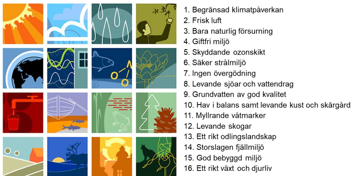
Figur 2. De nationella miljömålen.

De svenska miljömålen syftar till att skapa en hälsosam och hållbar miljö för både människor och natur. Målen strävar efter att minska miljöpåverkan, bevara naturresurser och förbättra livskvaliteten för nuvarande och framtida generationer.